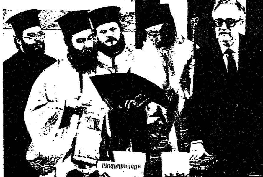
الرئيس اليوناني الجديد خريستو سارنتزيتاكيس يقسم اليمين